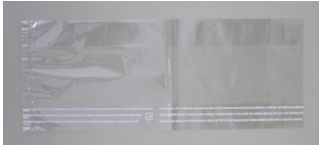
PF-308 はプラマークのみの印刷です